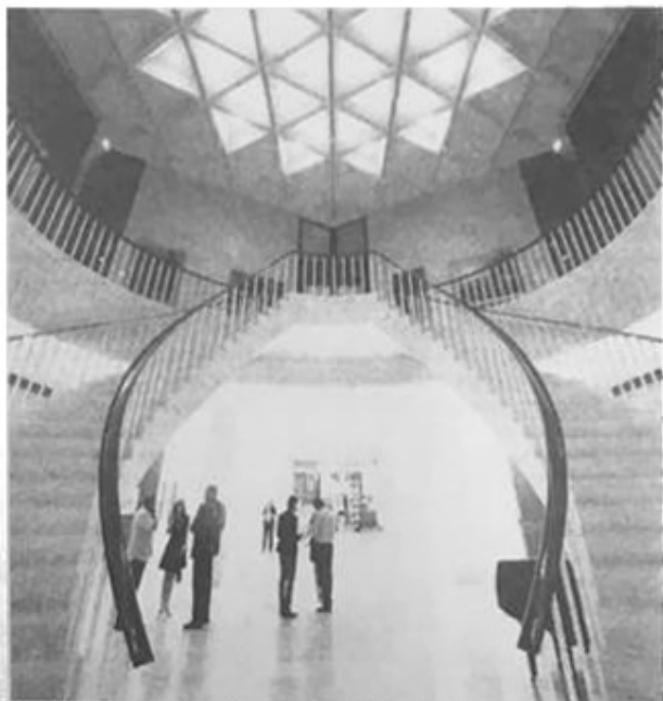
La gala apoya al Museo, así como los proyectos de desarrollo cultural y de impacto social que éste impulsa.